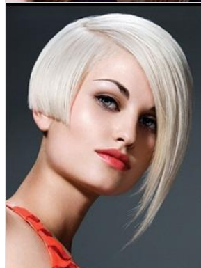
Модель женской стрижки «Каре»