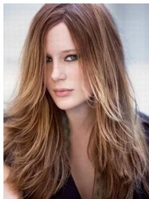
Модель женской ассиметричной стрижки