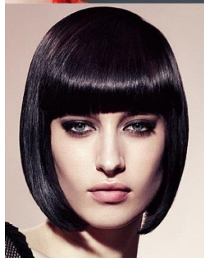
Модель женской стрижки «Каскад»